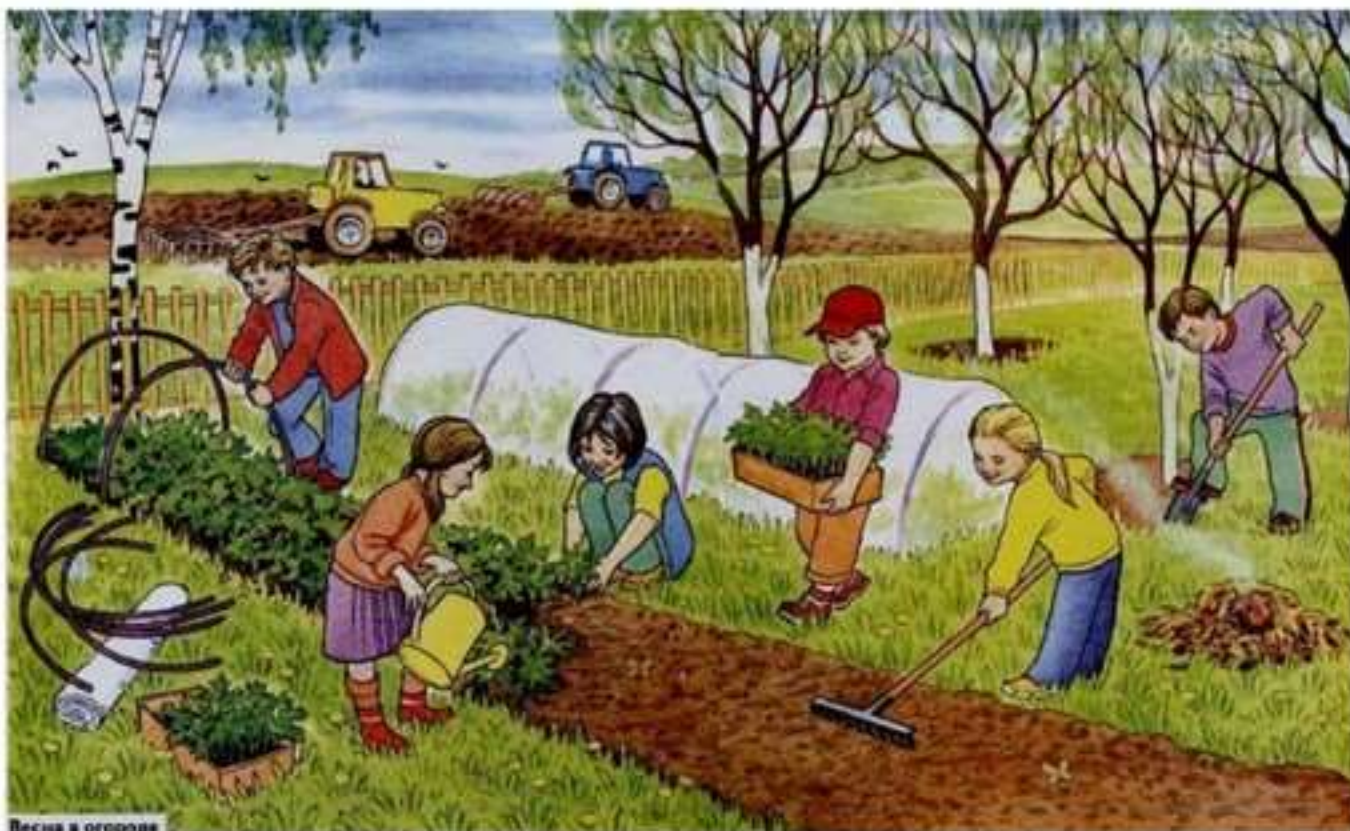
Весна в огороде

Необходимо назвать как можно больше слов-действий. Например: люди (что делают?): вскапывают землю, рыхлят землю, высаживают саженцы, сеют семена, строят теплицы, поливают, удобряют, пропалывают; трактористы в полях пахнут землю и засеивают поля зерном