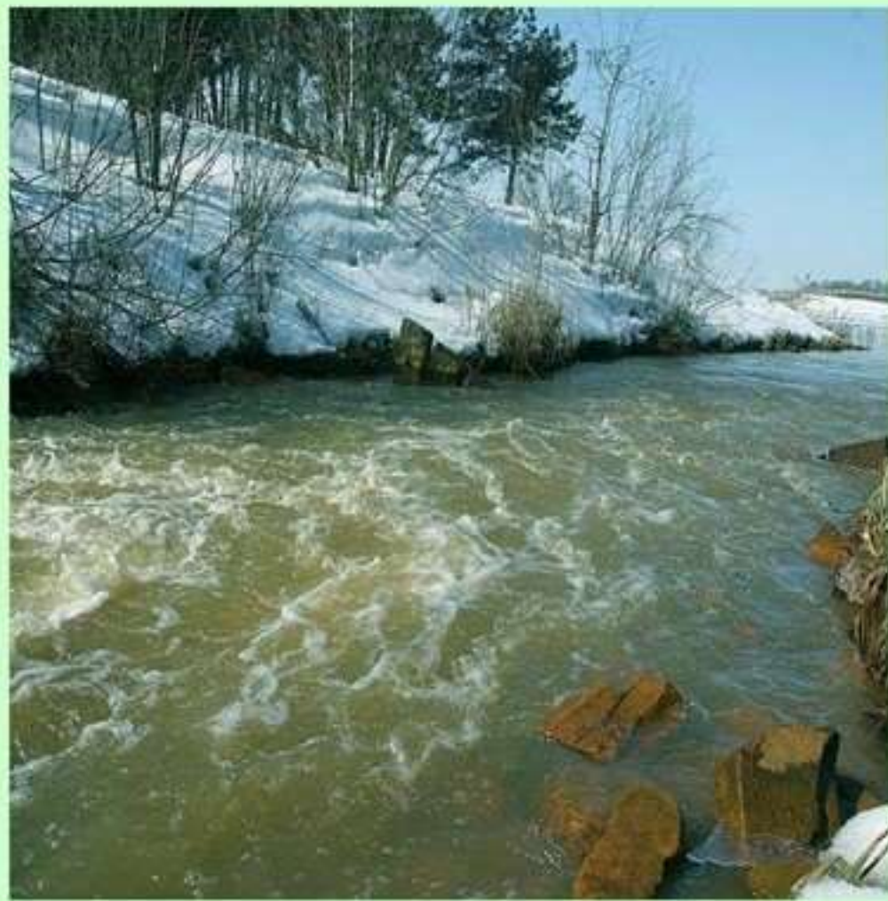
Ф. И. Тютчев